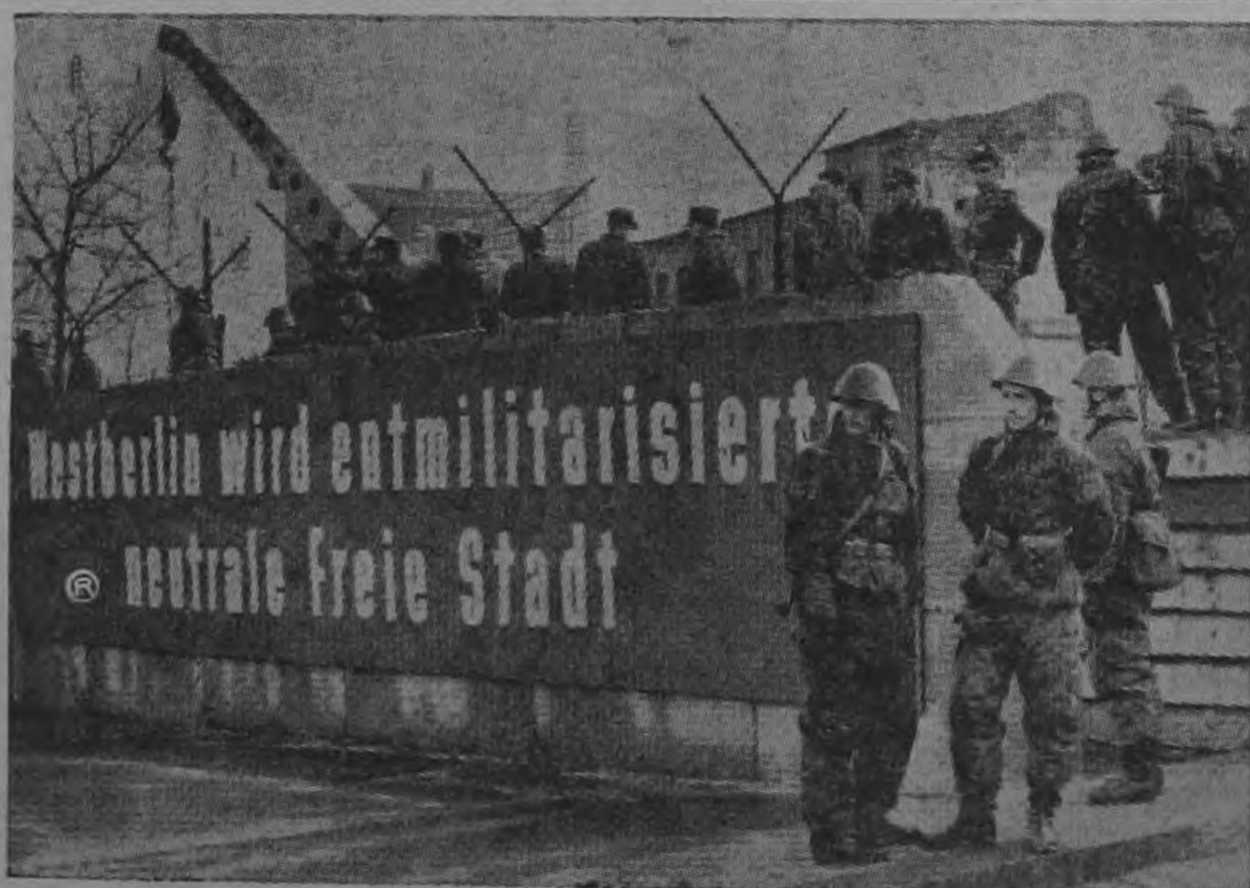
Los comunistas no pueden demostrarnos más claramente como imaginan su "desmilitarización, neutralización y liberación" de Berlín Oeste: Muro de la vergüenza, alambradas, ruinas y mercenarios armados por el comunismo mundial, son las únicas soluciones que a encontrado Ulbricht para resolver el problema alemán (tp) Berlín Occidental.