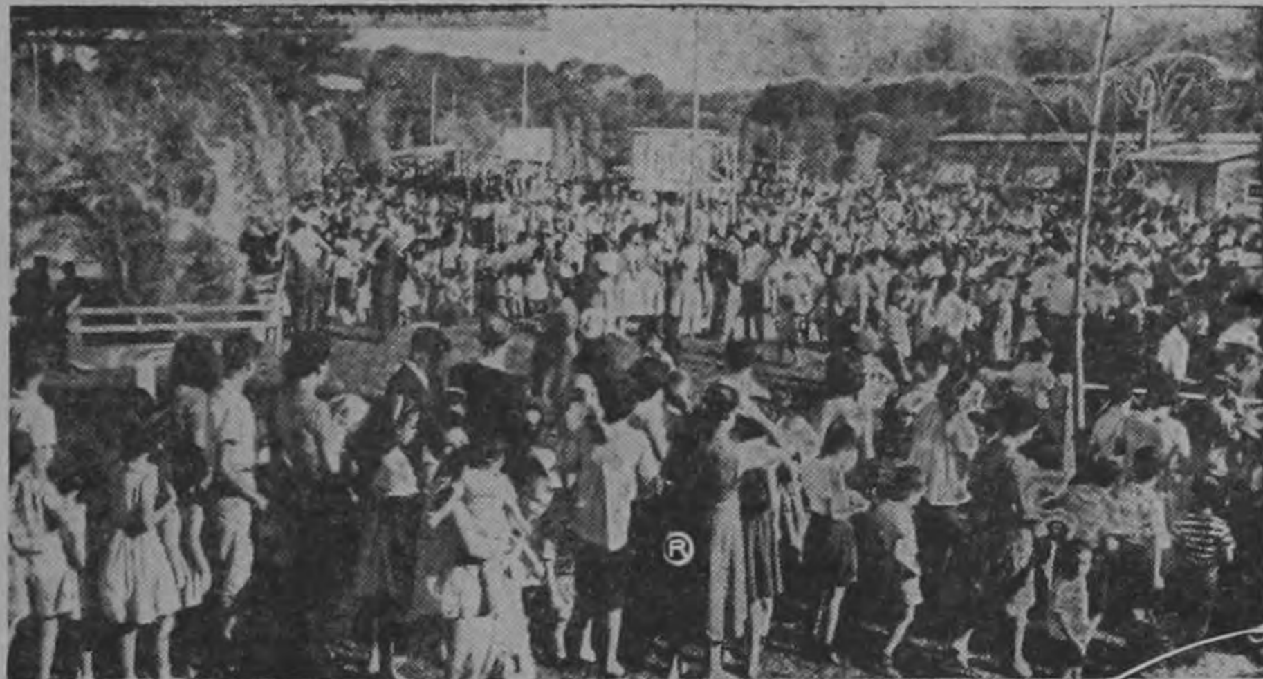
Un aspecto de la lucidísima fiesta que tuvieron los empleados del Instituto Costarricense de Electricidad el sábado pasado, celebrando la Navidad. Se efectuó en el club del ICE en Los Anonos y ha sido una de las más alegres y rumbosas que han tenido en dicha institución.